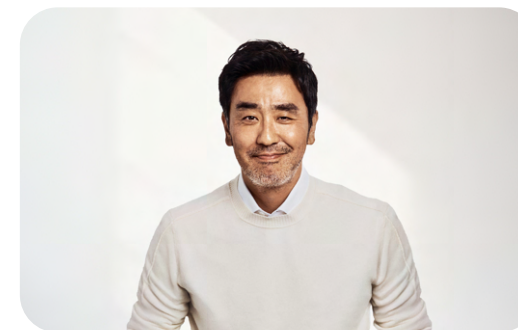
RYU SEUNG RYONG